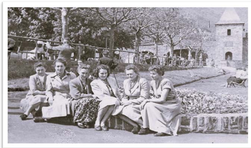
Bild 4, Elleringhäuser Damen auf Reisen

Viel Spaß beim Stöbern in den guten alten und auch jüngeren Zeiten um das kleine „Dorp Ellerkusen im Wildetale“.