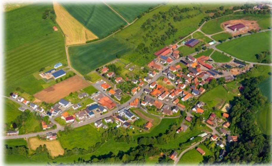
Bild 1, Luftbild