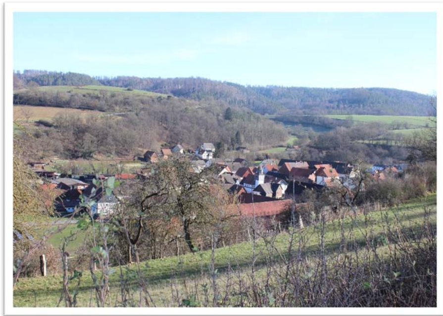
Bild 2, Elleringhausen vom Kehrbusch aus